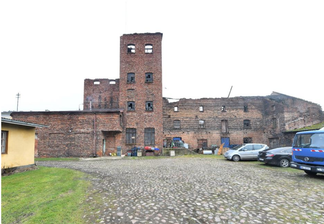
Budynek młyna, ul. Romualda Traugutta

Budynek młyna pochodzi z końca XIX w. W latach 50-tych XX w. budynek odebrany właścicielom na Skarb Państwa. Budynek murowany, z cegły, częściowo tynkowany. Obecnie w ruinie. Wymaga szeroko zakrojonych prac remontowo-renowacyjnych. Budynek posiada walory architektoniczne, zaprojektowany został na cele przemysłowe, w jednolitej stylistyce, typowej dla obiektów przemysłowych końca XIX w.