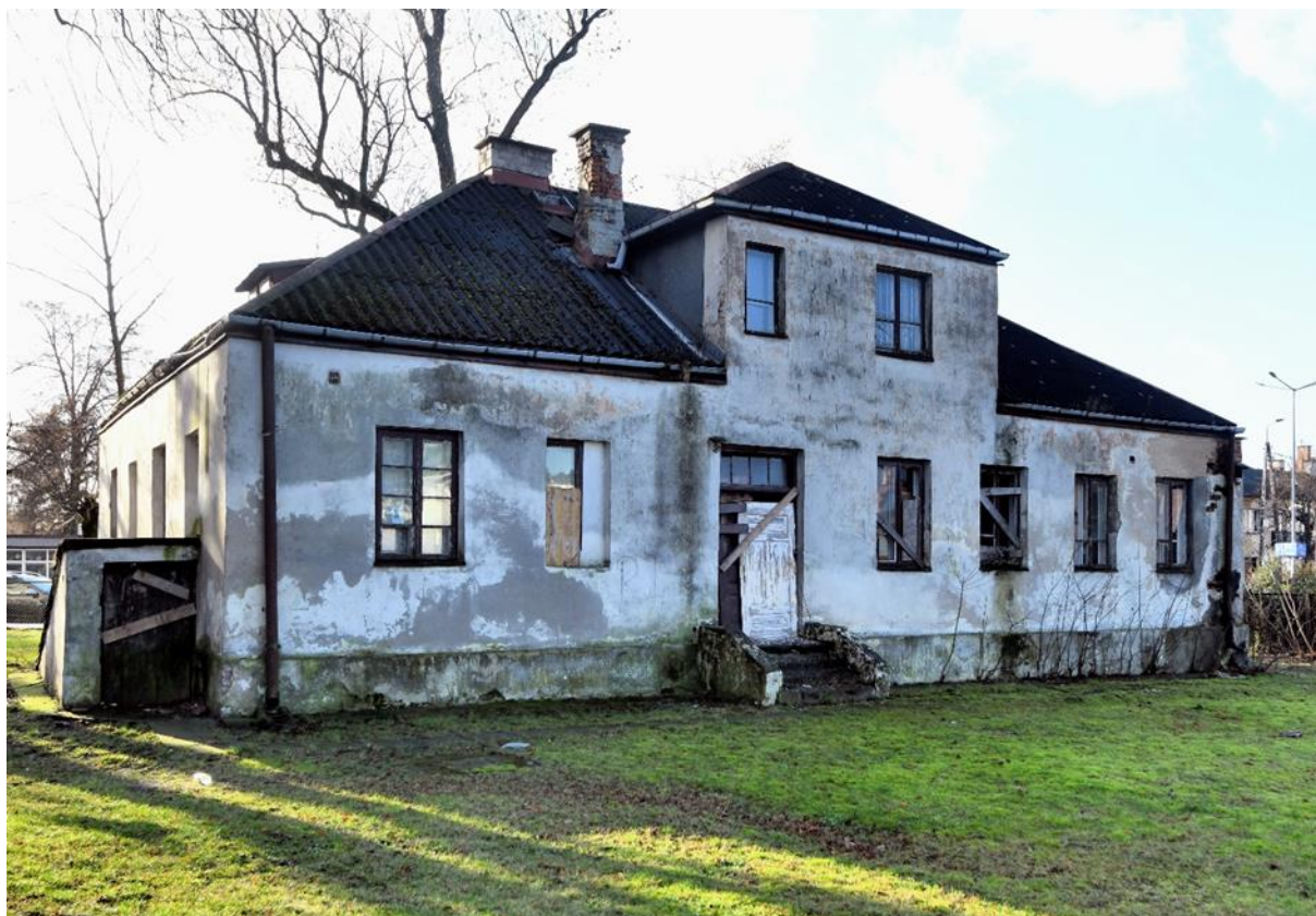
Budynek szkoły elementarnej – Plac T. Kościuszki 3