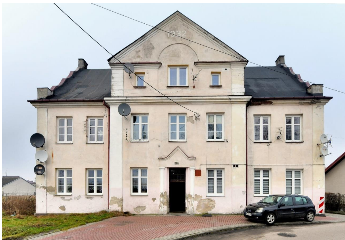
Budynek łaźni, ul. Zduńska nr 24