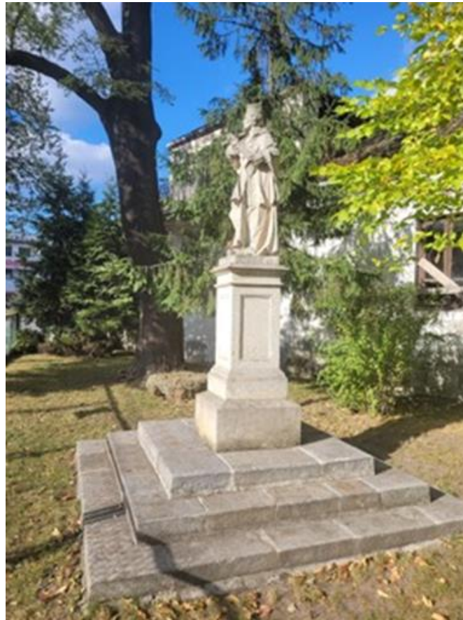
figura św. Jana Nepomucena

Figura św. Jana Nepomucena usytuowana w obrębie zespołu kościelnego, przed budynkiem szkoły elementarnej. Barokowa, pochodząca z II połowy XVIII w. figura została wykonana w piaskowcu. Postać świętego w kontrpoście, ubranego w starannie oddaną szatę z ozdobną stójką pod szyją, spod komży-rokiety wystaje dziewięć guzików sutanny. Figura ustawiona na prostopadłościennym postumencie wykonanym z piaskowca. Całość posadowiona na trójstopniowym fundamencie.